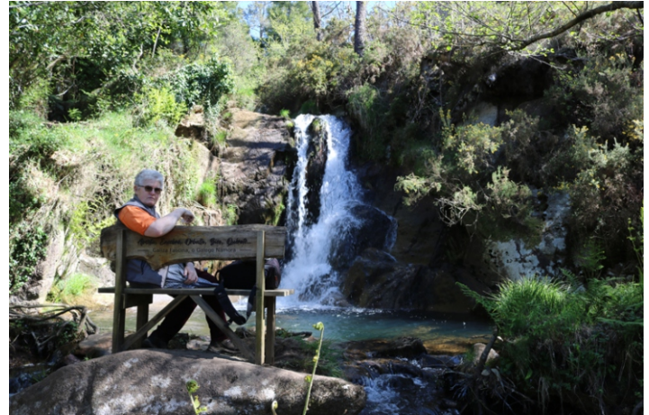
Fervenza de Budían

Unha camiñada por unha ruta ben sinalizada que aproveita os trazados de estradas, pistas e camiños actuais, camiños vellos, recupera tramos abandonados, e non vai máis alá do mínimo imprescindible nos trazados novos, para seguir uns tramos do curso do río Parga, do Sisto ou de Baio, segundo o lugar, e un dos seus regatos afluentes, aos que acompañan as súas ringleiras de árbores de ribeira, entre prados e monte no que mandan os eucaliptos que en zonas se enseñorean por enriba de uces apoucadas, carballos desmedrados e piñeiros vellos, e en outras son as únicas árbores dispostas en ringleiras nun terreo ermo ao pé do que en sitios aparecen residuos do bosque antigo cun mato no que medran acivros, sanguíños e arandeiros. Un percorrido que se pode facer enteiro ou por partes dependendo do noso interese con áreas nas que o que máis destaca é o natural -os ríos, a vexetación de ribeira e as fervenzas- e outras nas que os elementos sociais e etnográficos son os protagonistas -os numerosos muíños, as pontellas e outros elementos construtivos da contorna do río e dos lugares polos que pasamos.