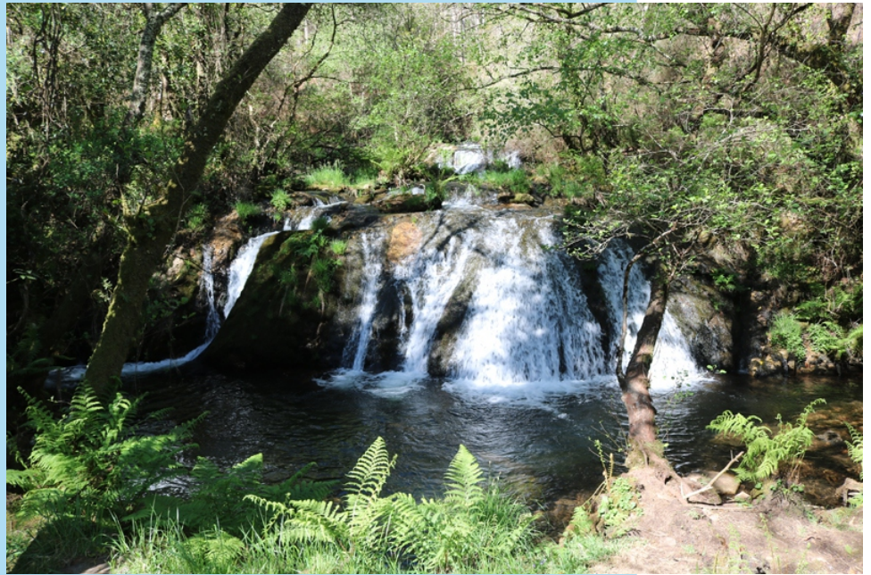
Fervenza de Parga ou do Pozo do Muíño