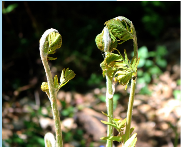
Frotas de dentabrú