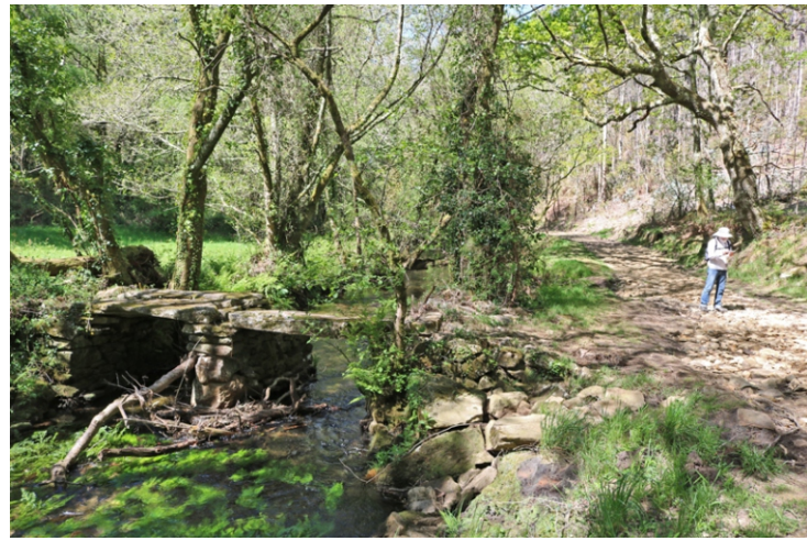
Pontella no Sisto

Podemos facer so o traxecto Rabiñoso, Parga, Budián e volta, no que vemos, a vexetación de ribeira os prados e o monte, as tres fervenzas e os tres grupos de muíños que hai ao seu carón, e o lugar de Parga.