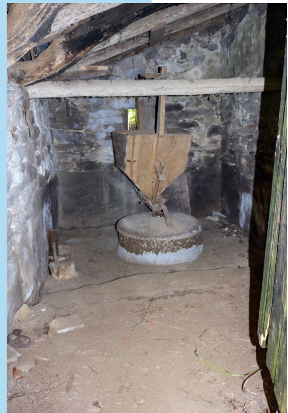
Interior dun muíño