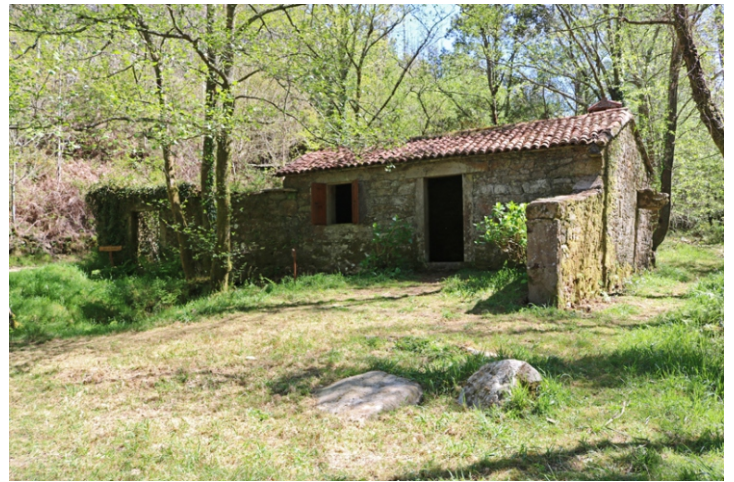
Muíños no Sisto