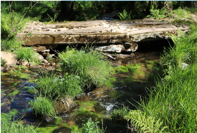
Pontella en Parga