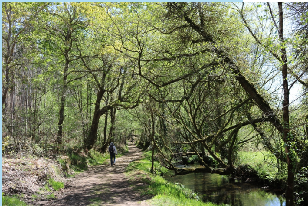
Camiño dos Cregos pola beira do río de Parga