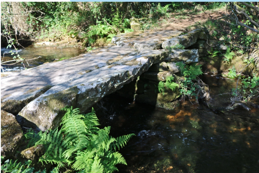
Pontella das Laxes