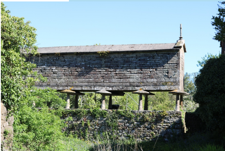
Hórreo en Parga