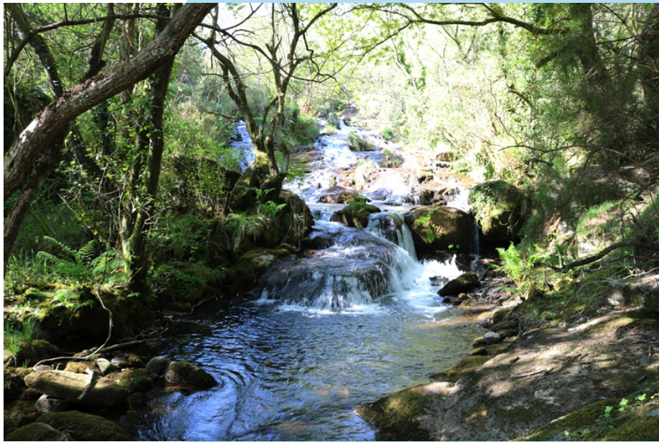
Fervenza de Rabiñoso no río Parga