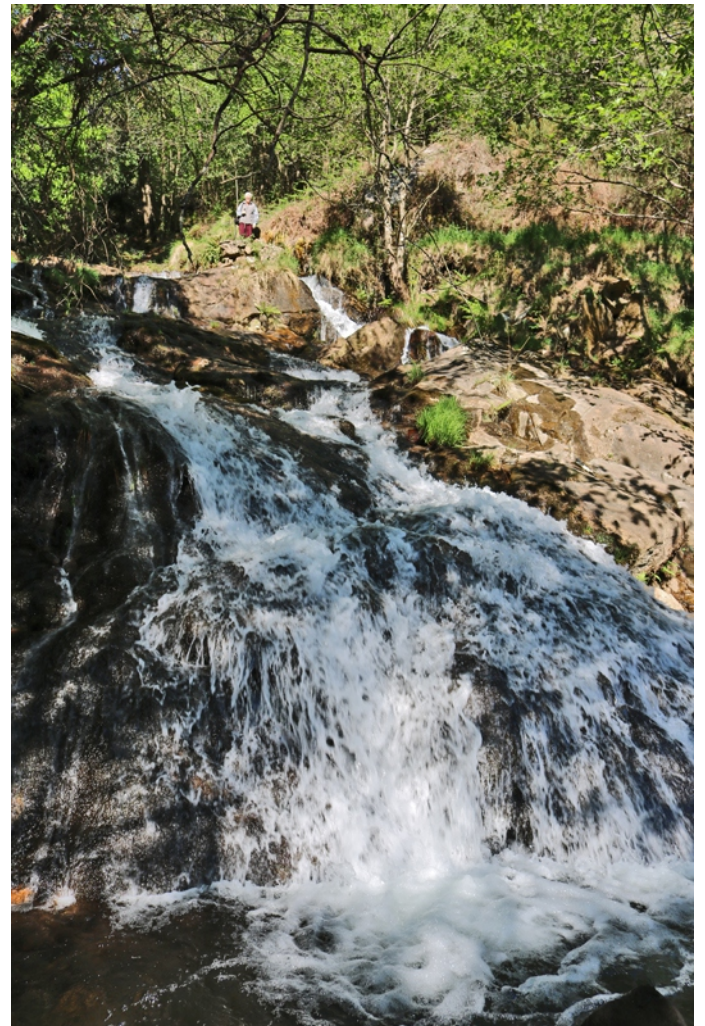
Fervenza de Rabiñoso

Unha camiñada por unha ruta ben sinalizada que aproveita os trazados de estradas, pistas e camiños actuais, camiños vellos, recupera tramos abandonados, e non vai máis alá do mínimo imprescindible nos trazados novos, para seguir uns tramos do curso do río Parga, do Sisto ou de Baio, segundo o lugar, e un dos seus regatos afluentes, aos que acompañan as súas ringleiras de árbores de ribeira, entre prados e monte no que mandan os eucaliptos que en zonas se enseñorean por enriba de uces apoucadas, carballos desmedrados e piñeiros vellos, e en outras son as únicas árbores dispostas en ringleiras nun terreo ermo ao pé do que en sitios aparecen residuos do bosque antigo cun mato no que medran acivros, sanguíños e arandeiros. Un percorrido que se pode facer enteiro ou por partes dependendo do noso interese con áreas nas que o que máis destaca é o natural -os ríos, a vexetación de ribeira e as fervenzas- e outras nas que os elementos sociais e etnográficos son os protagonistas -os numerosos muíños, as pontellas e outros elementos construtivos da contorna do río e dos lugares polos que pasamos.