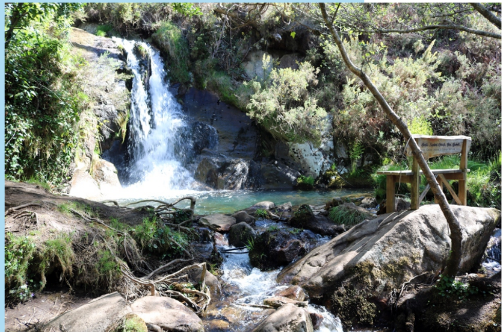
Fervenza de Budián ou do Muíño Vello, onde o Rego da Fervenza é compartido entre Zas e Coristanco